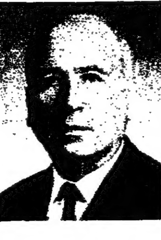
الدكتور والتر ايتان

ونظم الحكم الذاتي كاتبي يترجمه الرئيس السادات، حسبما افادت التقارير الصحفية، اذا ما قام «بمستوى كل من اسرائيل ومصر والولايات المتحدة» في شأنه في ادارته على قدم المساواة، ولكن لا كان هذا التقييم سيروم - كما يبدو الامور الآن - لكون مصر اسرائيل تجدان صعوبة في التوصل الى اتفاق بينهما حول قضايا اساسية، نيكسن انترافس الآن بان مصر واسرائيل يتحفظان في المناقشات الكتلانية حول هذه القضية من ذلك من نواحي مشروع الحكم الذاتي، في وقتين متتاليتين - وهذا يعني بان الصوت الحاسم في كل حالة سيكون صوت الولايات المتحدة.